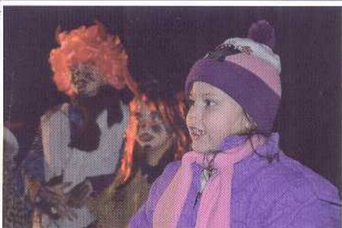
Obstát před čertem není jen tak!

Leťm neméně sám pak s andělem rozdál drobné dárečky. (více na str. 5)