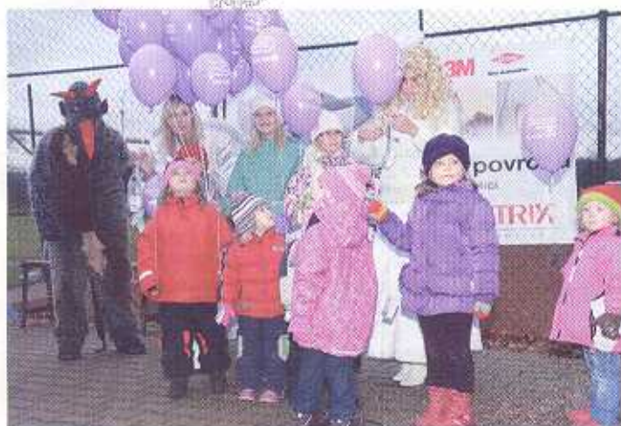
Častolovice poslaly 157 přání Ježíškovi

Malí i velcí se sešli na častolovickém hřišti a společně vypustili balonky s přáními Ježíškovi, (více na str. 8)