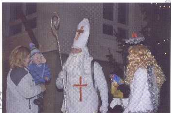
Mikuláš rozsvítil častolovický vánoční strom

Mikuláš i s anděly a čerty zavítal do častolovické základní školy a školky. Podle informací Zdroje si ale čerti nikoho neodnesli. (více na str. 9)