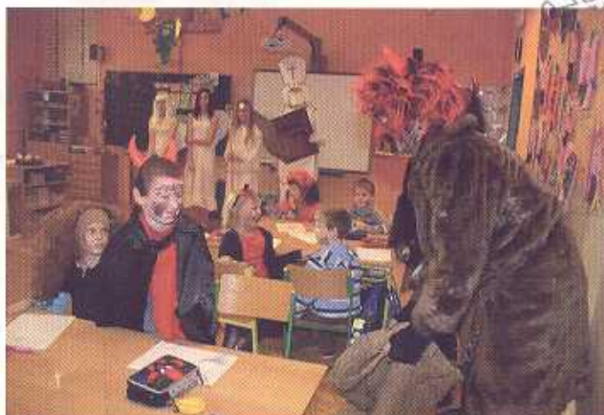
Mikuláš navštívil školu i školku

Malí i velcí se sešli na častolovickém hřišti a společně vypustili balonky s přáními Ježíškovi, (více na str. 8)