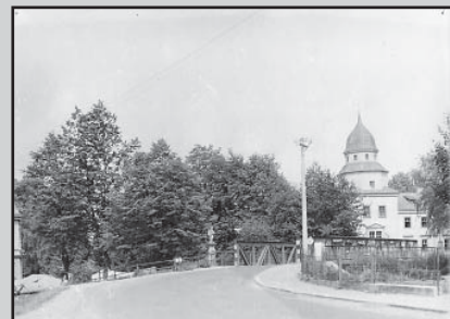
□ Foto 1 - Původní umístění ocelového mostu.