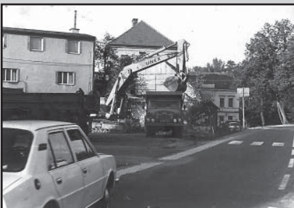
□ Foto 3 - Nájezd na původní most pod restaurací Beseda v roce 1983.

Vážení spoluobčané, pokud i vy vlastníte nějaké historické fotografie, dokumenty, případně jiné materiály ze života obce a jste ochotni se o ně podělit nebo máte k uveřejněním fotografiím nějaké poznatky, kontaktujte mne prosím osobně nebo na mobilním telefonu číslo 724178772.