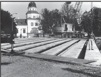
□ Foto 2 Pokládání železobetonové konstrukce v roce 1983.